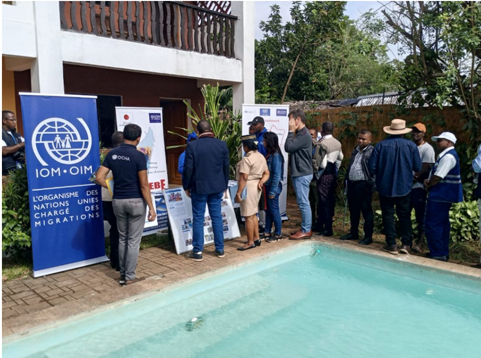
Les autorités gouvernementales, les agences des Nations Unies et les participants visitant le stand de l'OIM pendant la cérémonie et désireux d'en savoir plus sur les projet et les activités de l'OIM dans le sud-est de Madagascar.

A ce titre, l'OIM a reçu 700 000 USD, montant qui servira à assister 4 642 ménages (l'équivalent de 20 889 personnes déplacées internes) par la mise en place d'un programme « cash-for-shelter ». Ce transfert en espèces aidera les populations les plus touchées et les plus vulnérables à réhabiliter leurs abris, qui ont partiellement ou complètement endommagés et/ou détruits. De même, trois centres communautaires, endommagés par le cyclone Freddy, seront également réhabilités dans la ville de Mananjary.