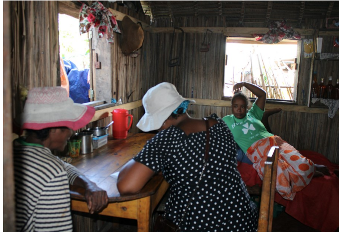
Photos prises lors de la visite conjointe de l'OIM et de la IFRC sur le terrain à Mananjary.