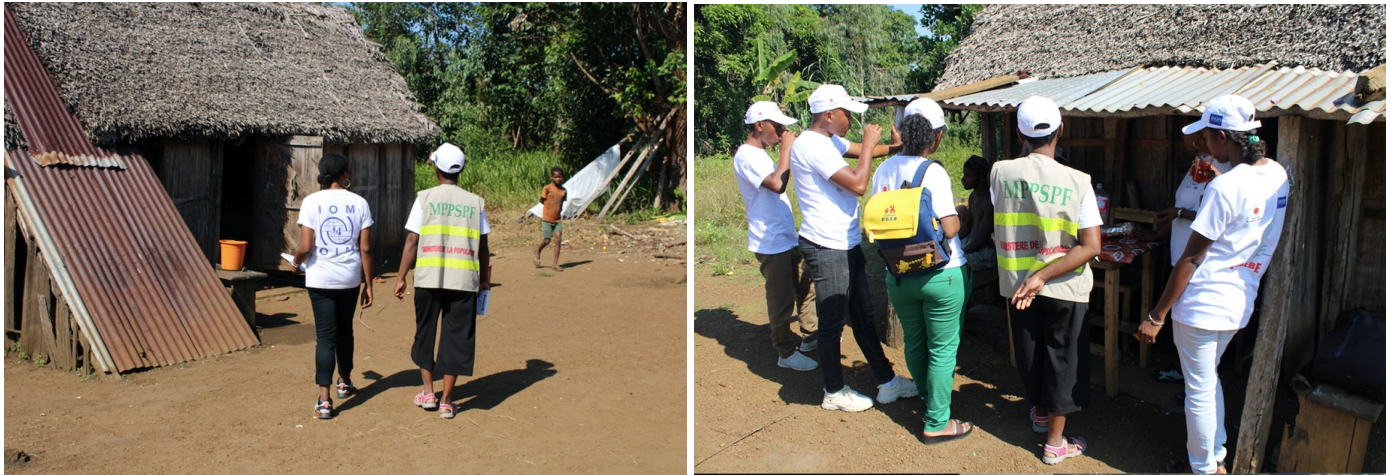
Photos prises lors de la visite pour la préparation au lancement de l'activité d'appui psychosocial et de protection sociale dans la commune de Mangatsiotra le 20 mai.

Dans le cadre du projet Sorebe, les activités MHPSS pour le soutien psychosocial ont été lancées à Mangatsiotra, dans la région de Fitovinany.