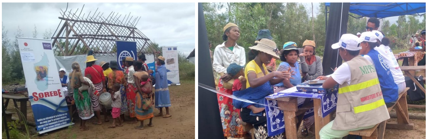
Photos prises le 24 mai, lors de la rencontre avec les associations dirigées par des femmes de 5 fokontanys dans la commune de Mangatsiotra, région Fitovinany.

De plus ce jour-là, 28 personnes de la commune ont bénéficié d'une assistance psychosocial individuelle de la part des professionnels identifiés par la DRPPSPF; et 8 cas de VBG et maltraitance envers les enfants ont été identifiés et référencés.